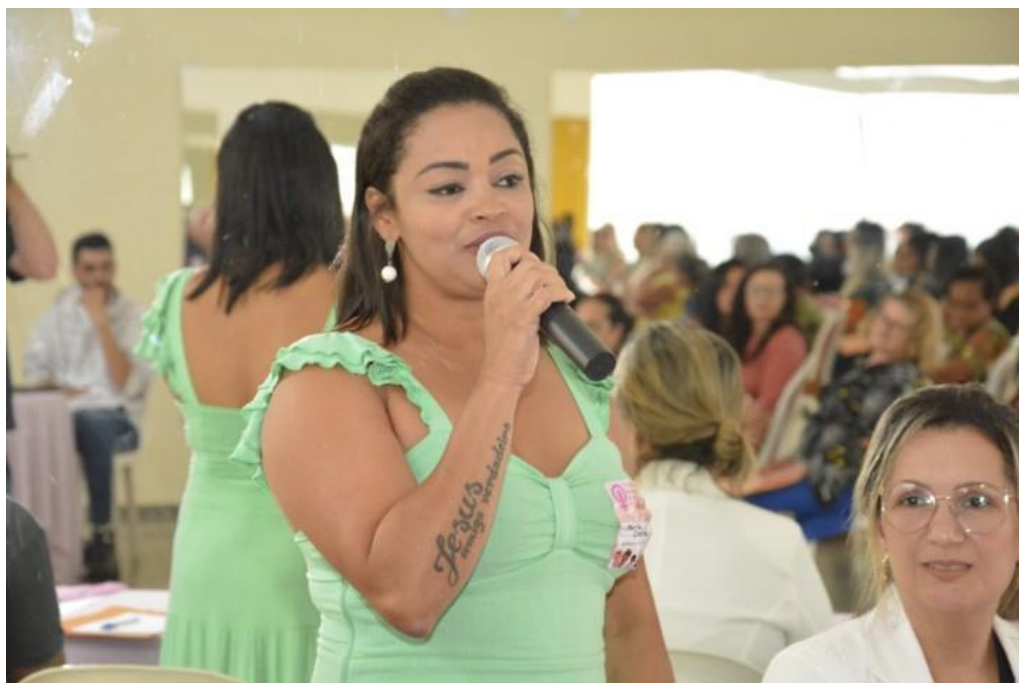
SECRETÁRIA DE ASSISTÊNCIA SOCIAL KARLA GONÇALVES VALENTIM