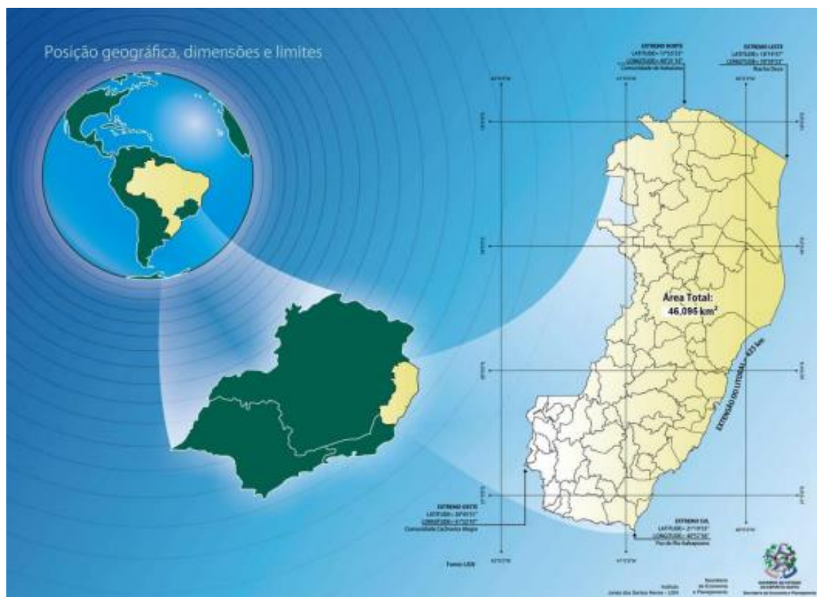
Figura 2 - Localização do estado do Espírito Santo.

Tem como bioma predominante a Mata Atlântica, sendo comum floresta tropical e vegetação litorânea. O estado dispõe de dois tipos de relevo distintos, o litoral e o planalto. Além disso, todo o território estadual possui clima tropical úmido com temperaturas médias anuais de 23°C e volume de precipitação superior a 1.400 mm por ano (GOVERNO ES. 2020).